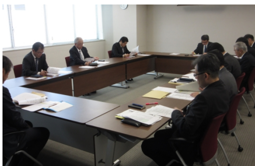
安全施策 2015 マネジメントレビュー