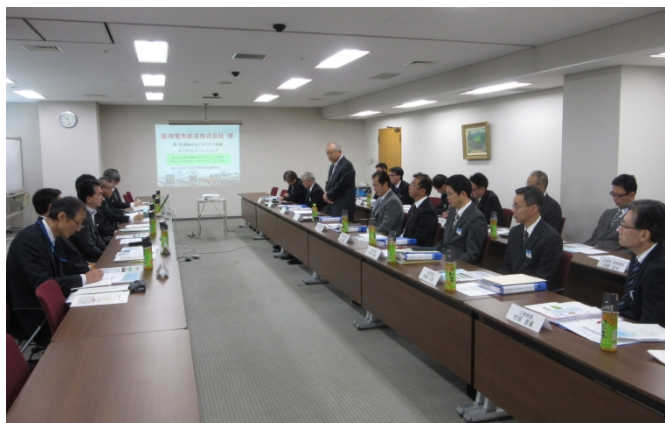
平成 27（2015）年度の運輸安全マネジメント評価

なお、前回評価において当社の安全管理体制の維持及び改善に関する取組みについて一定の評価をいただいたことから、前回評価から概ね 1 年を経過する時期において、安全管理の取組み状況を中間報告することとなり、その内容を踏まえ次回評価が実施される旨、国土交通省より通知を受けています。