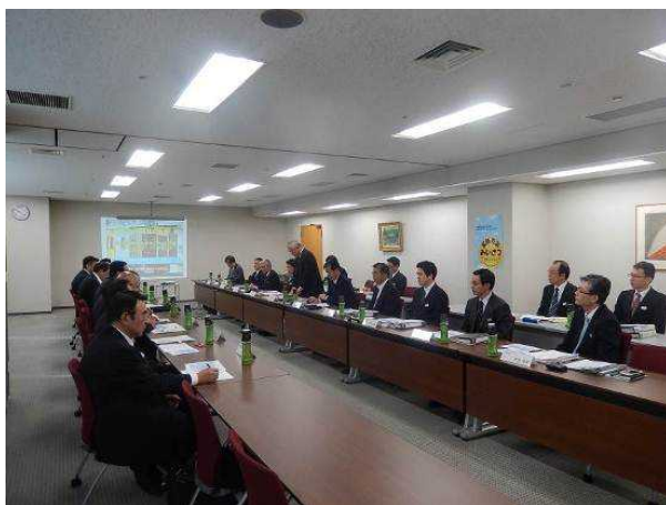
平成 25 (2013) 年度の運輸安全マネジメント評価

6 回目となる平成 25 (2013) 年 10 月の運輸安全マネジメント評価では、安全管理体制の維持及び改善に関する取組みについて一定の評価を受け、次回の評価が前回評価から概ね 2 年後となる旨、国土交通省より通知がありました。この際、前回評価後ほぼ 1 年後に安全管理の取組み状況を中間報告することとなっており、国土交通省に対し、平成 26 (2014) 年 10 月に報告書を提出しています。