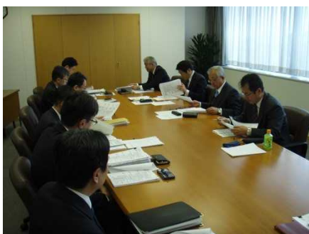
安全施策 2014 マネジメントレビュー

※マネジメントレビューとは、安全管理体制が適切に運営され、有効に機能していることを確認し、必要に応じて見直し・改善を行う活動です。